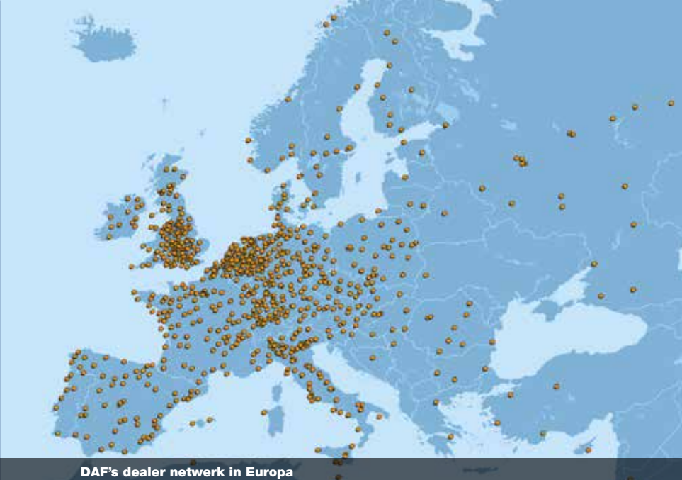
DAF's dealer network in Europa