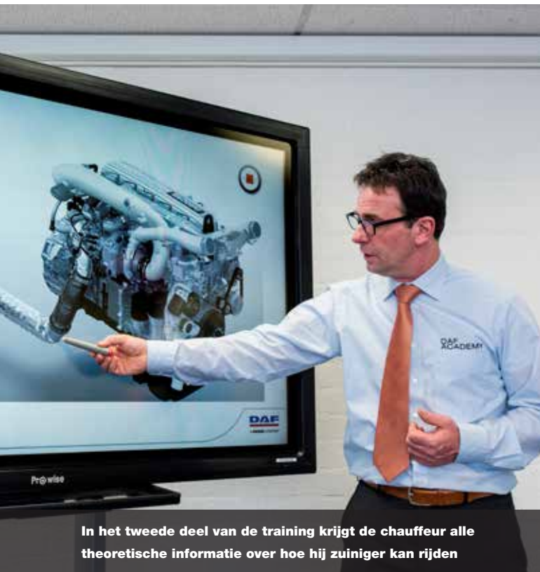
In het tweede deel van de training krijgt de chauffeur alle theoretische informatie over hoe hij zuiniger kan rijden