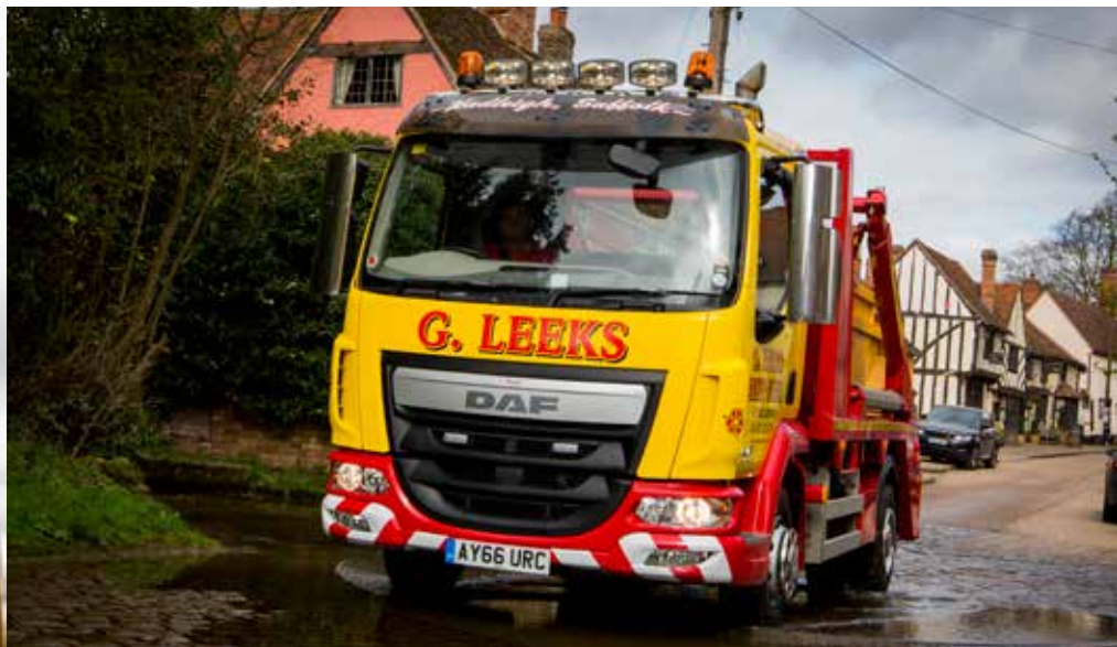
Alan Planck is enthousiast over de rij-eigenschappen van zijn LF