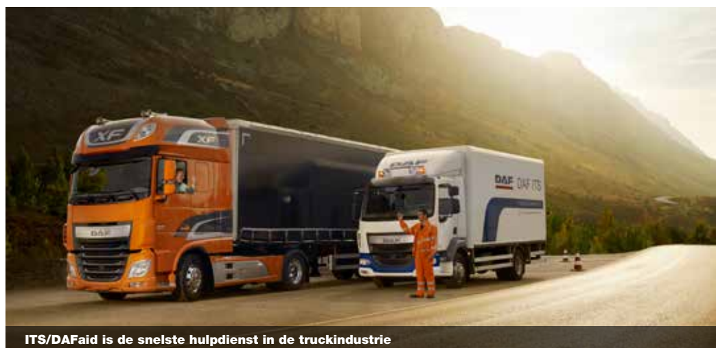
ITS/DAFaid is de snelste hulpdienst in de truckindustrie

pijlers Sales, Service en Onderdelen passen perfect onder de DAF-paraplu. Het is een teamspel en elk lid van het DAF-netwerk is daarin een belangrijke speler." ■