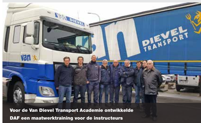
Voor de Van Dievel Transport Academie ontwikkelde DAF een maatwerktraining voor de instructeurs

Meer weten over DAF Chauffeurstrainingen? De DAF-dealer bespreekt graag de verschillende opties met u. ■