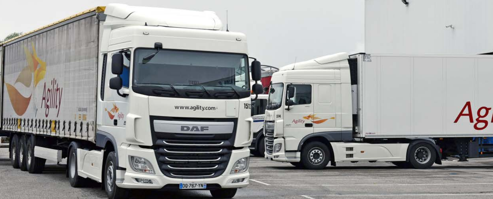
plate-forme Carrefour en Lorraine, Nestlé, etc.). Le groupe s'est développé avec la reprise de SITS en 2002 qui opère dans le transport de marchandises entre la Suisse et la France (plus de 100 camions en exploitation). Puis Jean-Claude Portmann crée Portmann Lux, filiale en charge de la gestion des flux entre le Luxembourg et l'Europe de la sidérurgie (Arcelor Mittal). Cette année-là, Traklux est reprise (société de location de tracteurs avec chauffeur). Puis c'est la création de